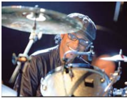
Manu Katché